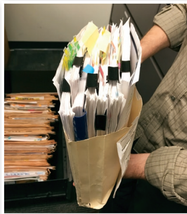
Legacy case management system

L'ufficio di grafica editoriale procura tutto il materiale di marketing ed istituzionale, indirizzato sia all'interno che all'esterno dell'azienda, con un repertorio di oltre 60 tipi di media in 30 lingue diverse. Il lavoro di questo ufficio era basato al 90% su carta, con i documenti raccolti in cartelle fisiche contenenti informazioni per lo più scritte. Questo sistema di gestione dei casi richiedeva molto tempo e risultava inefficiente. I flussi di lavoro, per molti anni, sono stati gestiti manualmente e i fascicoli venivano spostati fisicamente tra i diversi gruppi di lavoro, creando spesso colli di bottiglia. Le bozze e i documenti finali dovevano essere stampati e poi aggiunti al fascicolo.