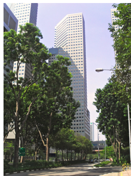
Asien Zentrale, Singapur

Das anhaltende Unternehmenswachstum basiert auf einer stark kundenorientierten Softwareentwicklung und einer engen Beziehung zu den Mitarbeitern der ISIS Papyrus Kunden, sowie deren Geschäftstätigkeit. Beispiele des Erfolges sind etwa, dass in den USA mit Software von ISIS Papyrus mehr als die Hälfte der amerikanischen Kreditkarten ausgegeben wird. In der EU erzeugt ISIS Papyrus im Finanz- und Telekommunikationssektor so viele Dokumente wie kein anderer Softwareanbieter.