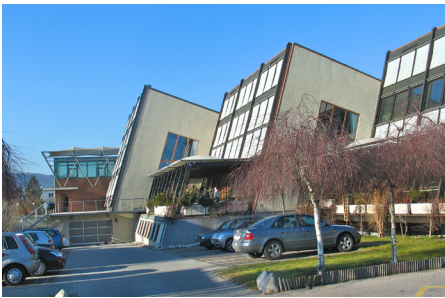
Internationale Zentrale, Wien, Österreich