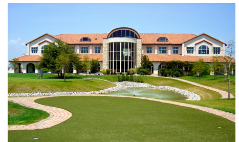
Amerika Zentrale, Dallas, Texas

gesteuerte Papyrus Geschäftskommunikationsplattform an. Durch eine Fokussierung auf Servicekonsolidierung und nicht auf reines SOA, oder starres Java oder XML, kann Papyrus durch seine vollintegrierte Plattform eingehende und ausgehende Informationen nahtlos durch sämtliche Prozesse von Großunternehmen transportieren und dazugehörige relevante Informationen miteinbeziehen und gemeinsam in Kundenanwendungen verarbeiten.